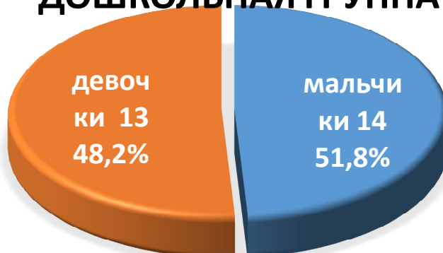
Таблица социального состава семей МОУ «ООШ с.Верхазовка»